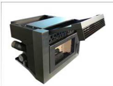
Vue de côté avec le tiroir ouvert.